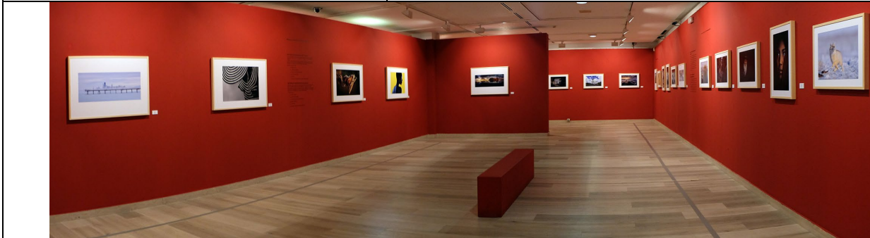
Exhibition dedicated CEF Gold medals and CEF Honorable Mention of the Salon