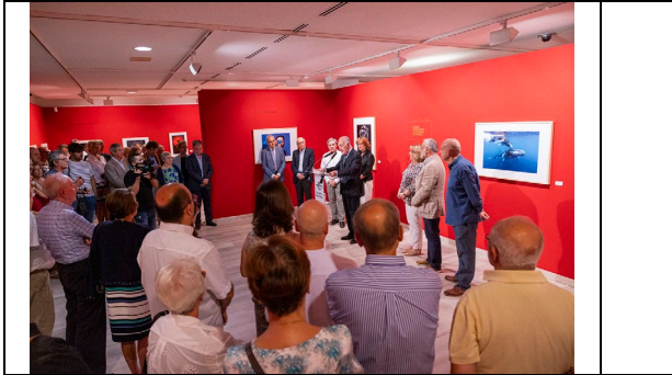
Inauguración de la exposición / Exhibition opening