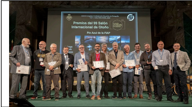
Ceremonia de entrega de Premios / Awards ceremony