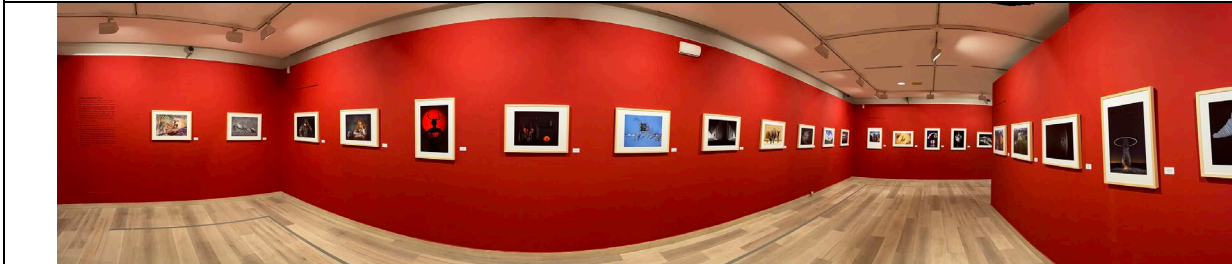
Exhibition dedicated to the best author of the Salon (FIAP Silver Medals and and FIAP Honorable Mention)