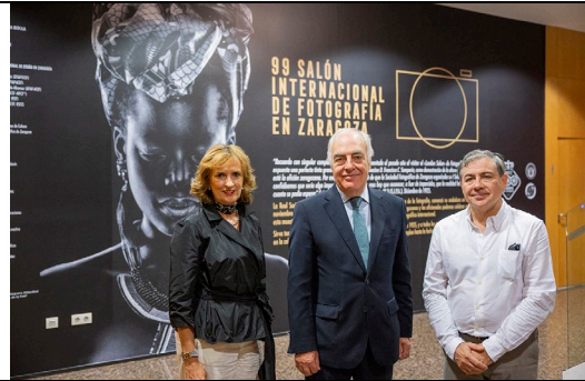
Cartel anunciador y autoridades Ibercaja / Exhibición poster